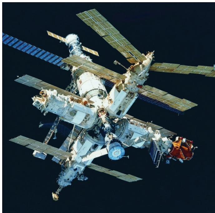
Рис. 2. Орбитальный пилотируемый комплекс «Мир»